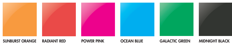
SUNBURST ORANGE RADIANT RED POWER PINK OCEAN BLUE GALACTIC GREEN MIDNIGHT BLACK