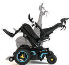
Neigungswinkel verstellbar (nach hinten)