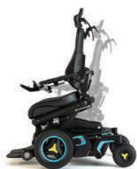
Neigungswinkel verstellbar (nach vorne)